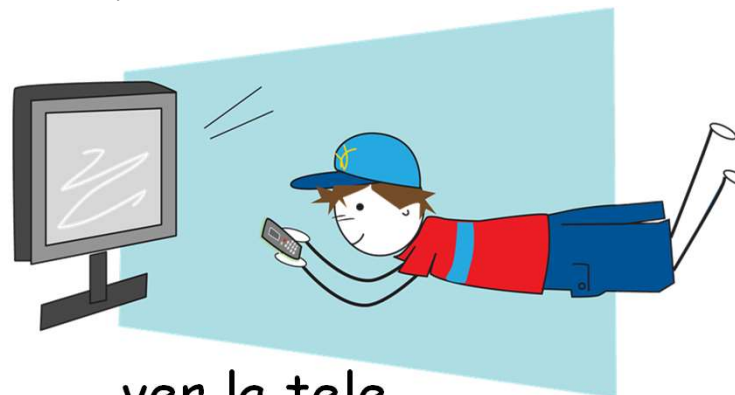
ver la tele